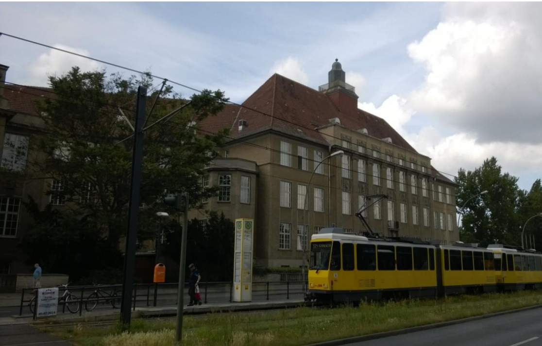
budova bývalé chlapecké vyšší reálné školy a dívčího lycea na Hermann-Duncker-Straße