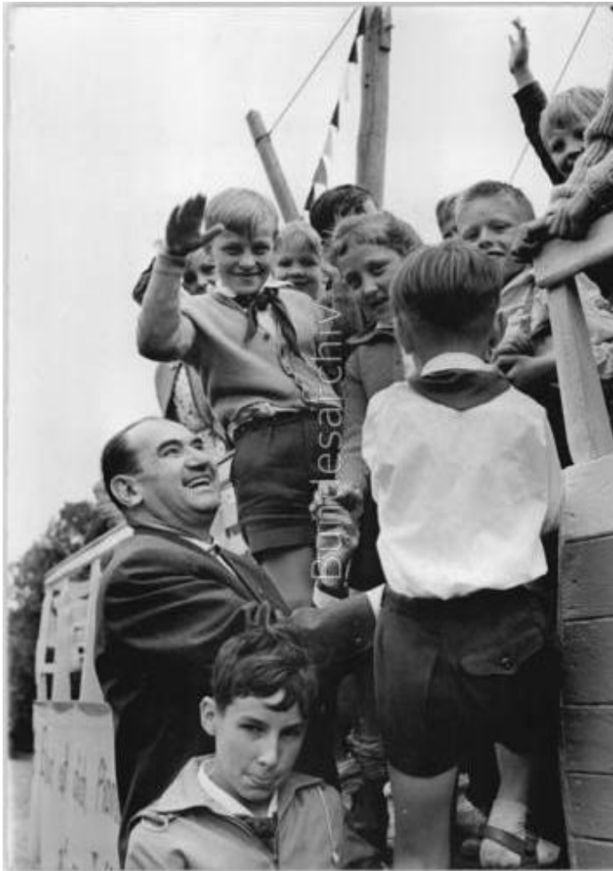
10. Juli 1961