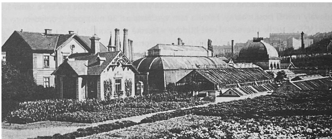
Rajská zahrada na Žižkově – místo, kde je dnes komplex VŠE (1907)

Ke studiu mohli být přijati ti, kteří úspěšně vykonali maturitní zkoušku a byli ředitelem školy doporučení k vysokoškolskému studiu - přihlášku na VŠ neposílal uchazeč, ale samy školy. Následovalo též samozřejmě složení přijímací zkoušky. V 2. pol. 50. let mělo studium na VŠE standardní délku 10 semestrů a zimní i letní semestr převážně trval 16 týdnů. Součástí studijních plánů byly i povinné "provozní a studijní praxe", které později zabíraly až třetinu studijního plánu. Studenti v denní formě studia nemohli být v žádném zaměstnaneckém poměru (míněná je pracovní smlouva, nikoli brigáda). Ubytování na koleji stálo 40 Kčs měsíčně a jídlo ve školní menze si bylo možno pořídit za 2,60 Kčs – připomínáme, že je nutné vnímat v širším cenovém kontextu doby.