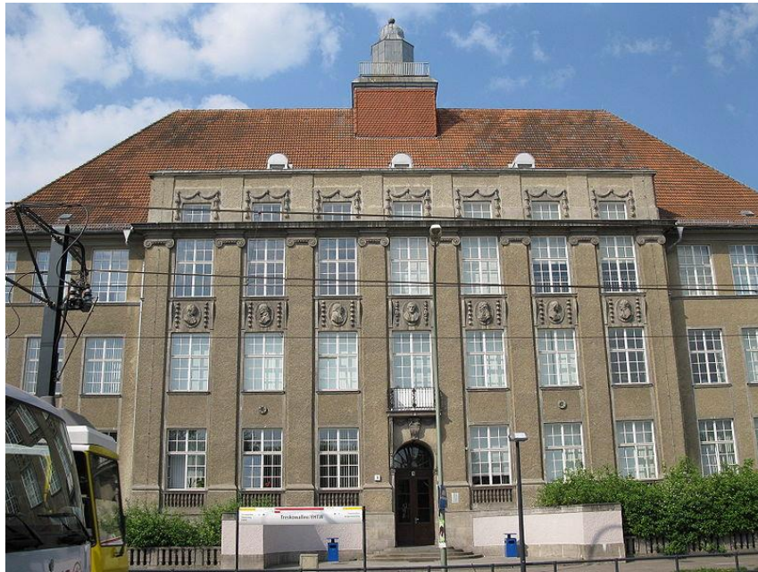
budova bývalé chlapecké vyšší reálné školy a dívčího lycea na Hermann-Duncker-Straße