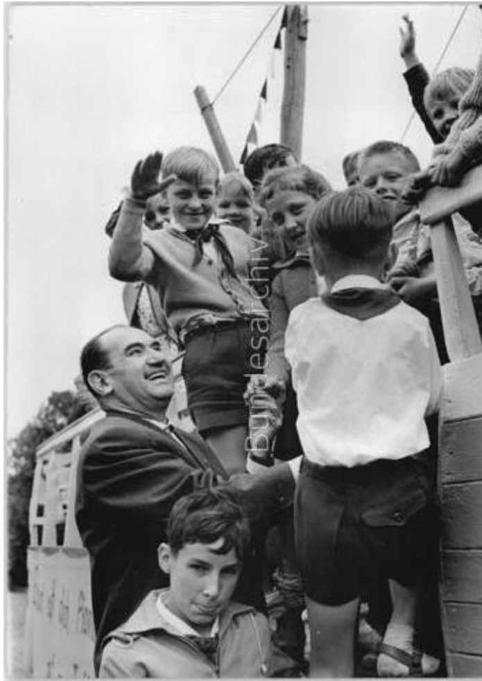
10. Juli 1961